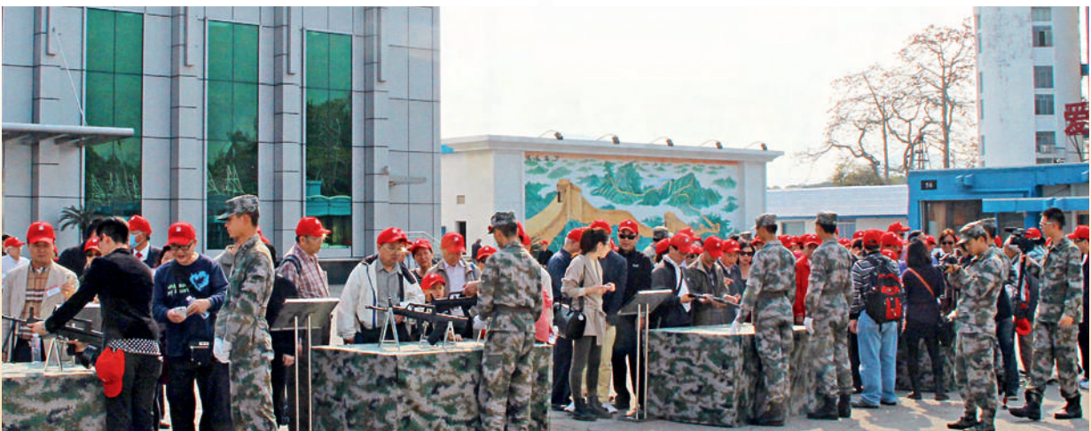
■ 近距離接觸武器裝備。