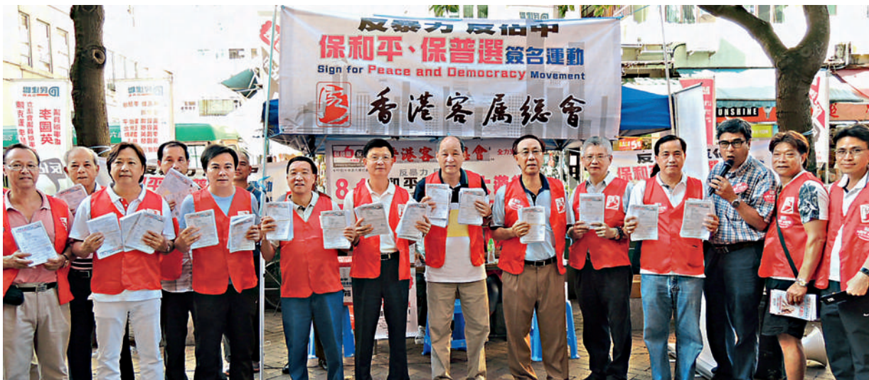
■ 本會多名首長出席大埔的簽名表交收儀式，該區共收到逾萬份簽名表。