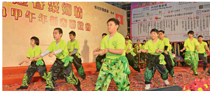
■ 客屬少年上台表演活力十足的客家功夫，既可將傳統發揚光大，又可強身健體。