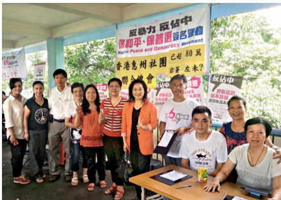
■ 香港惠陽聯誼會設於上水火車站天橋的街站人流暢旺，收集到不少熱心市民的簽名。

「保普選反佔中大聯盟」自7月19日起展開為期近1個月的簽名行動。本會在接獲通知後，立即啓動宣傳、落實收集會員親友簽名，客屬總會除聯繫各屬會外，更在新界地區特別是客家人多的地區收集簽名，惠州社團總會則負責統籌惠州社團，而河源社團則由河源社團總會負責。