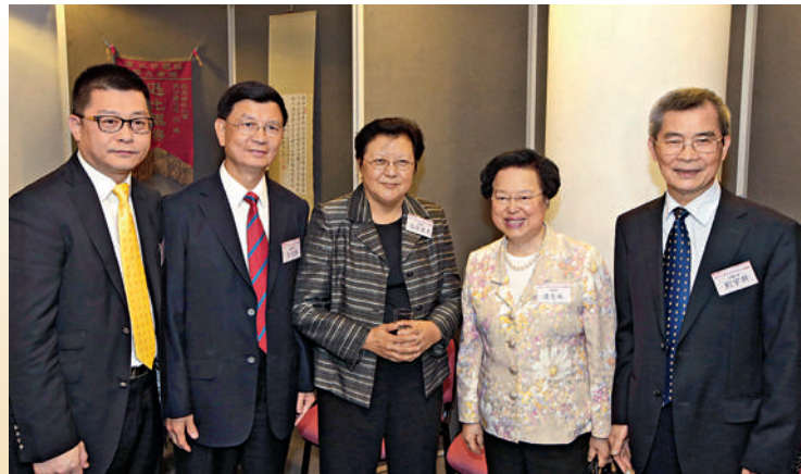
■ 左起：主禮嘉賓曾智明、梁亮勝、范徐麗泰、譚惠珠、劉宇新於大型展覽上相聚。