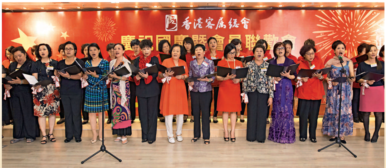
■ 本會婦女部滿懷激情大合唱，將國慶酒會氣氛推向高潮。

他說，客屬總會作為眾多社團中一面愛國愛港旗幟，在梁亮勝主席帶領下，經大家共同努力，近年來為香港的繁榮穩定，為香港愛國愛港力量的發展壯大，作出了非常重要的貢獻，並勉勵本會繼續高舉愛國愛港旗幟，為「一國兩制」、為國家興旺發達繼續作出貢獻。