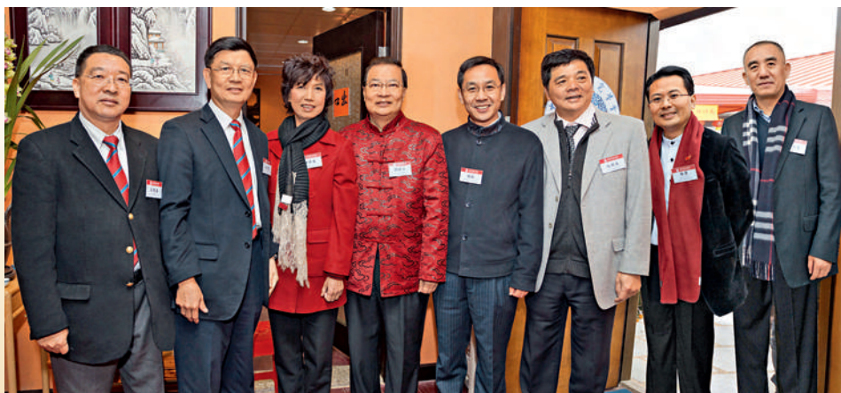
■ 新春歡聚。左起：本會吳惠權副主席、梁亮勝主席、廣東省委統戰部蔣樂儀常務副部長、民建聯譚耀宗主席、中聯辦青年工作部陳林部長、香港工商總會張興來主席、全國人大代表、新界社團聯會陳勇理事長、全國人大代表李引泉。