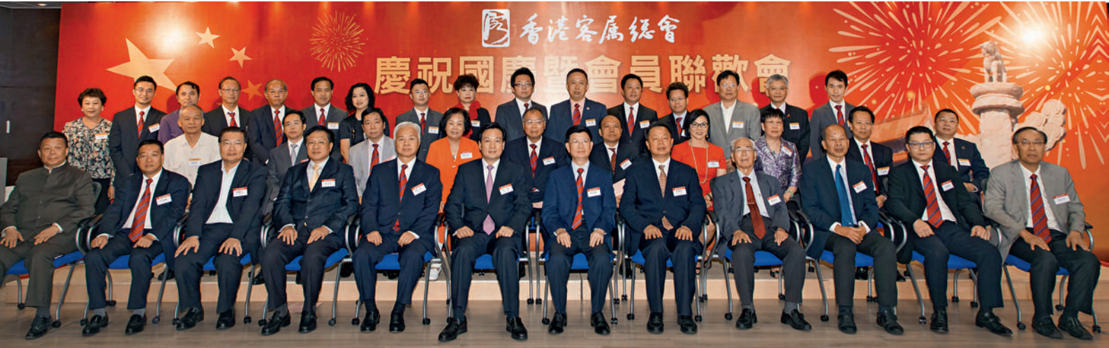
■ 中聯辦副主任林武（左六）、駐港部隊副司令員陳維展少將（右五）、中聯辦社團聯絡部部長李汝求（左四）與本會及各客屬社團首長合照。

2013年10月11日，本會假會所隆重舉行「中華人民共和國成立64周年慶祝酒會暨會員聯歡會」。中聯辦副主任林武，解放軍駐港部隊副司令員陳維展少將應邀出席並擔任主禮嘉賓，與本會主席梁亮勝、執行主席楊釗等首長及會員逾300人同申慶賀。