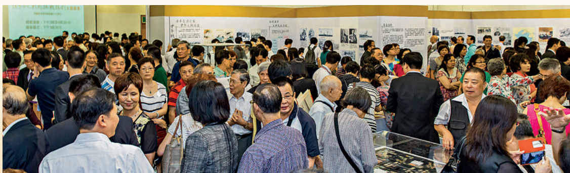
■ 大型展覽吸引眾多市民全神貫注地觀賞展品。