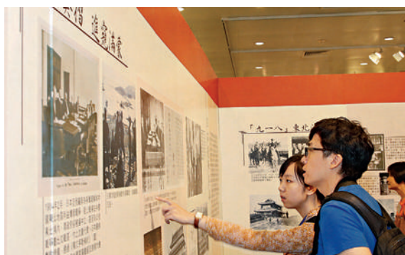
■ 青年人聚精會神地參觀展覽，深入認識歷史之餘，又有助承傳歷史真相。

籌委會主席梁亮勝表示，冀通過展覽激勵更多人承擔起愛國愛港的歷史擔當，為中華民族復興和香港繁榮穩定作出更大努力。他指出，今年是甲午戰爭120周年，也是新中國成立65周年，明年將迎來抗戰勝利70周年，所以舉辦今次展覽，因為只有不忘歷史苦難，民族厄運才不會重演。他接着表示，120年前的甲午戰爭刺激了日本侵略者對外擴張的野心，也改變了中國的命運。1937年日本全面侵略中國，中國人民用了8年艱苦抗戰才取得勝利。當前，日本安倍政權蠢蠢欲動，他們修改和平憲法，擴充軍力，挑戰鄰國，為軍國主義招魂。展覽旨在提醒全世界人民對軍國主義抬頭的勢力保持高度警惕。