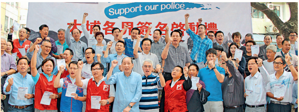
■ 本會發動客屬社團支持「保普選反佔中大聯盟」發起的支持警方簽名大行動。