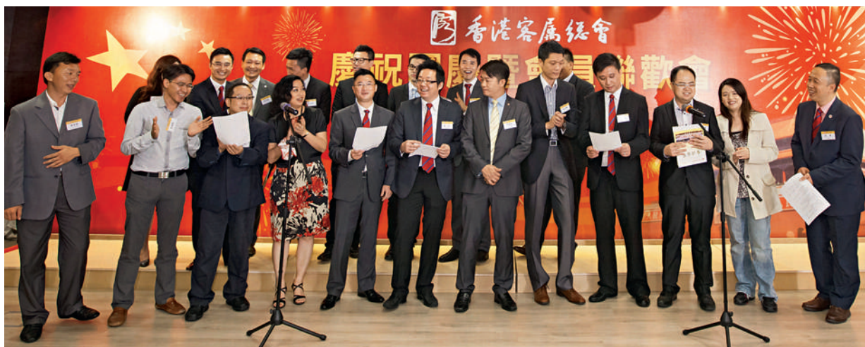
■ 本會青年部以喜悅的心情高歌一曲，與鄉親們共祝國慶。