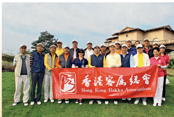
■ 原廣東省省長黃華華（中）、多位原廣東省、廣州市領導，與本會首長在清遠獅子湖國際高爾夫球俱樂部切磋球技。

2013年11月16至17日，本會組團前赴清遠舉行會員同樂日，近100位客屬總會首長、會董、屬會會員及家屬參加，包括：主席梁亮勝；副主席兼秘書長曾智明；副主席吳惠權、簡松年伉儷、鄧婉玲、古爾夫、余鋒光、鍾偉平伉儷；榮譽顧問藍鴻震伉儷；吉林省政協常委徐莉等。客屬鄉親們獲清遠市委統戰部設晚宴款待，清遠市委副書記梁志強；清遠市政協副主席、市委統戰部部長吳顯標；副部長潘汝波等親自接待。而廣東省委統戰部常務副部長蔣樂儀得知客屬總會到清遠觀光拜訪，專程到清遠與客屬鄉親一敘及合照。