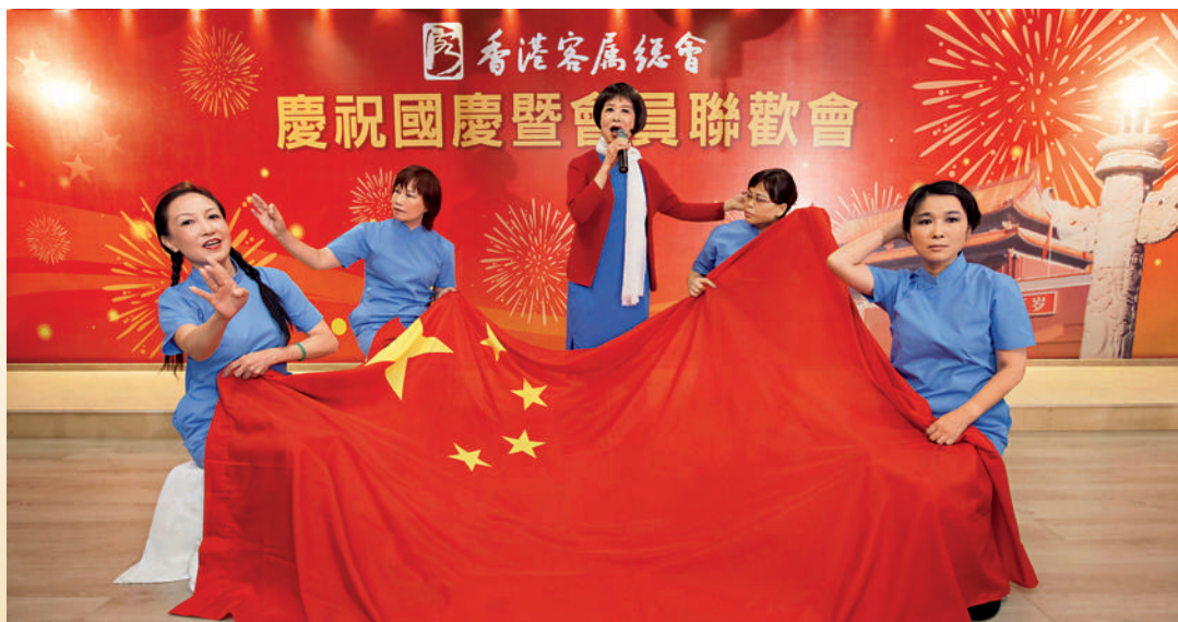
■ 港區梅州市各級政協委員聯誼會委員表演歌舞《繡紅旗》，贏得全場熱烈的掌聲。