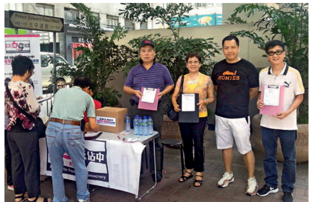
■ 位於太子的街站是香港惠陽聯誼會的九龍區基地，也是簽名表格的收集熱點之一。