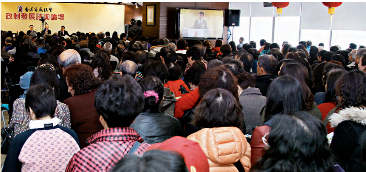
■ 逾500位來自65個屬會的首長及會員參加本會舉辦的政制發展諮詢論壇。