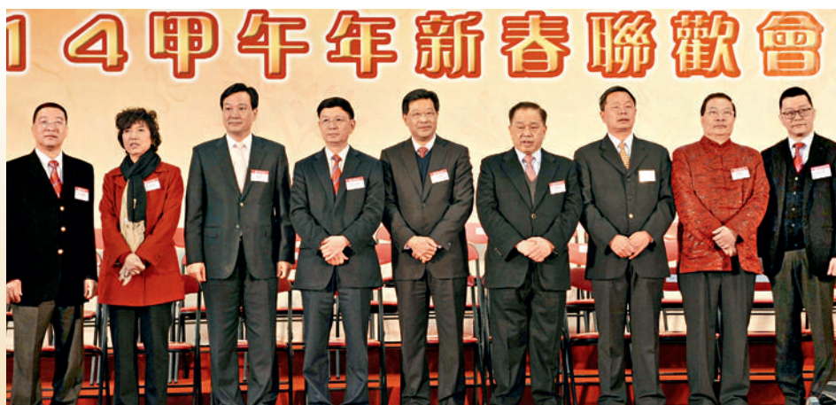
■ 主禮嘉賓與部分總會首長於台上合照。

2014年2月16日，本會主辦的「客屬迎春聚鄉情」2014甲午年新春聯歡會在大埔林村許願廣場舉行，筵開600多席，逾6000名本港客家鄉親歡聚一堂，共嘗客家美食，喜迎新春。