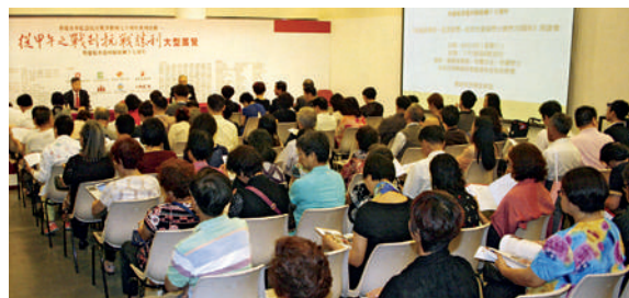
■ 展覽同場舉辦專題講座，剖析抗戰史實。