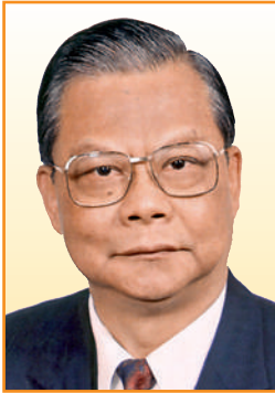
曾憲梓博士 榮譽主席