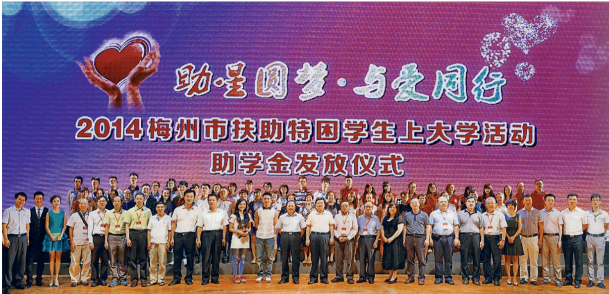
■ 2014年8月，由香港嘉應商會支持的「愛心行」項目——「助星圓夢·與愛同行」，2014梅州市扶助特困學生上大學活動助學金發放儀式在當地舉行，相關部門領導在儀式上與受助學生合照。

本會團體會員一向熱心公益，延續客家人注重教育的優良傳統，尤其重視客屬新生代的供書教學，鼓勵成績優異的學生接受高等教育，故歷年在家鄉舉辦過多次獎助學金捐贈儀式，讓莘莘學子受惠，助山區貧困學生一圓上大學的夢。