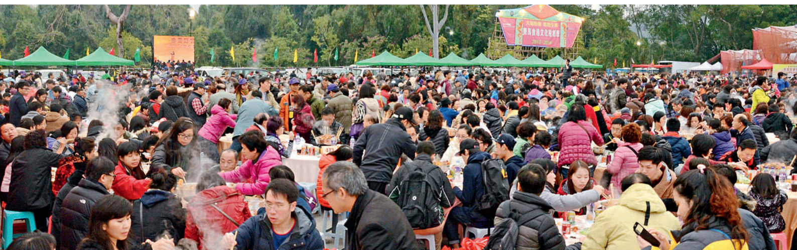
■ 逾6000客屬鄉親濟濟一堂，同嘗客家美食，林村許願廣場洋溢節日的熱鬧氣氛。