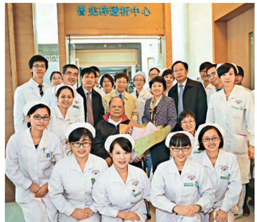
■ 曾憲梓（圖中）捐資200多萬元建設血液透析中心，在揭幕時與廣東省中醫院「曾憲梓透析中心」的醫務人員合照。