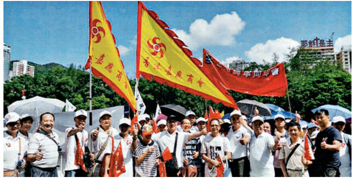
■ 香港嘉應商會的首長及會員踴躍參加遊行，以示客家人團結、愛國愛港愛鄉的精神。

組織和參加大型遊行活動讓本會工作人員體會到，這類活動除了提供資源之外，還需要大量的聯繫統籌工作，更需要各屬會的實力，以及總會與屬會的良好關係、首長的親和力等，這全都可由本次大遊行的順利進行中展露無遺。