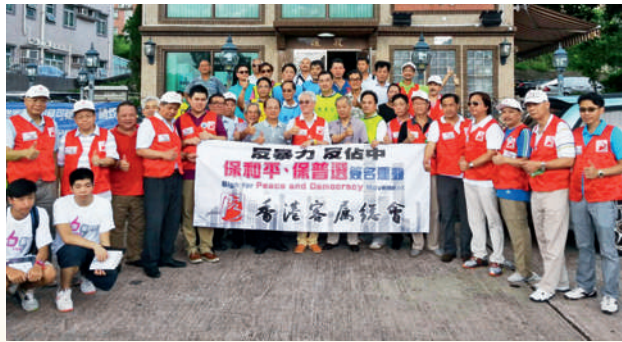
■ 2014年7月27日，本會多名首長親往大美督、龍尾等客家村落，呼籲村民簽名。