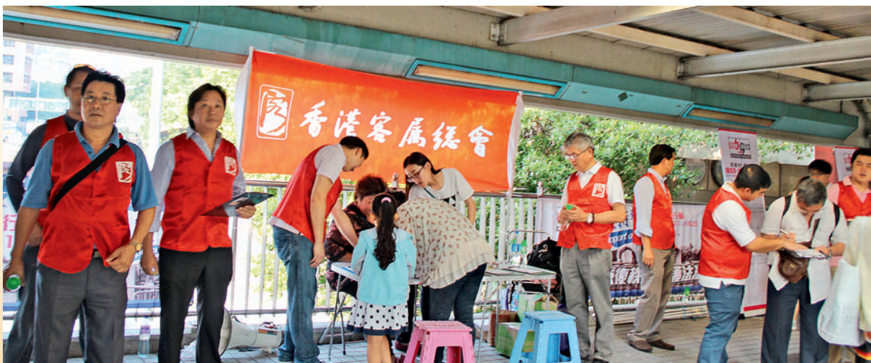
■ 紅磡的街站於短時間內獲眾多支持者前來簽名。