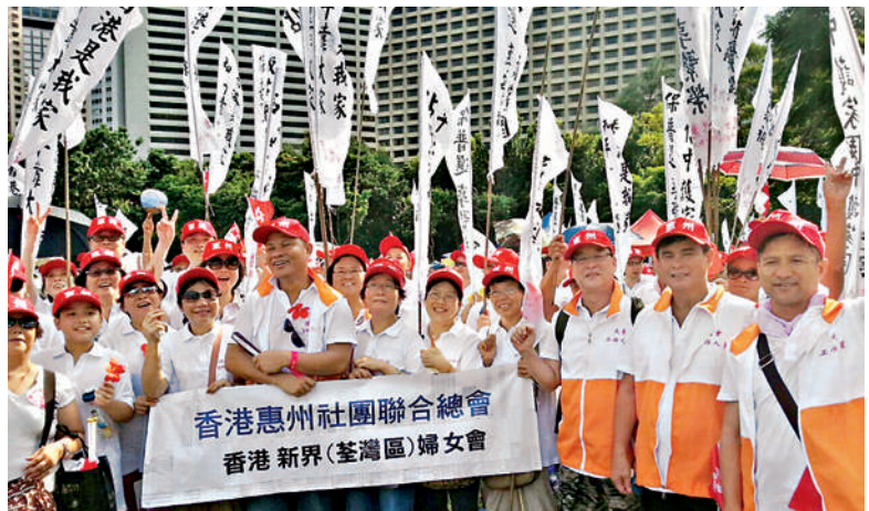
■ 香港惠州社團聯合總會共15個屬會、3千多人參與大遊行，場面浩大。

原本客屬團體計劃組織約8000至10000人的遊行隊伍，幸得各屬會首長的推動，在逼近活動日前的兩三天，愈來愈多會員及親友報名參加（亦有89歲的會員親身參與），終於目標達成，共有近2萬名客屬會員及親友參加。過程中彼此相互支持鼓勵，確實是一種很好的體驗，成果令人振奮。