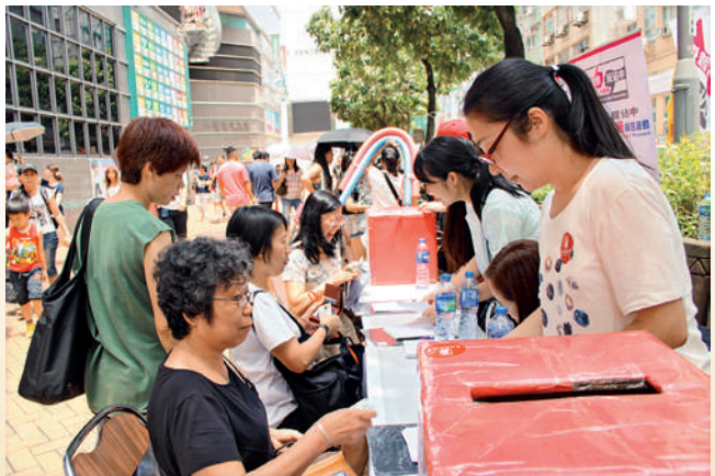
■ 本會在大埔區設立多個簽名街站，以增加宣傳效用，其中包括人流最暢旺的大埔新街市，方便區內居民買東西時前往簽名支持。