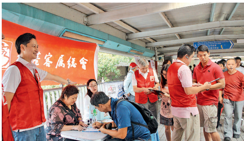
■ 街站甫設好，隨即獲得前來簽名的熱心市民支持。

客總其後積極協調各屬會，在九龍及新界設立24個街站，共動用接近1700多位義工，其中主要分別於九龍、新界多個地區設置簽名站。其中大埔、上水、土瓜灣、佐敦、紅磡的街站於短時間內獲眾多支持者前來簽名，廣收宣傳之效。至目前為止，客籍人士共收集到4萬多份表格。