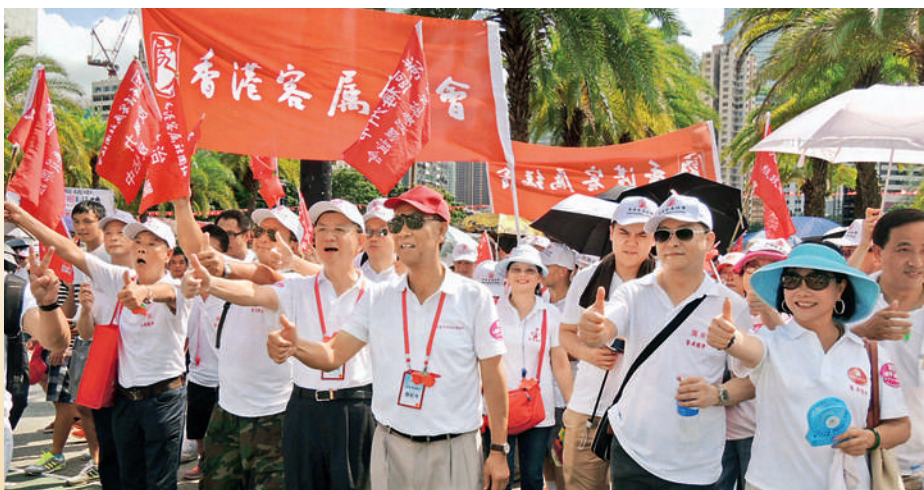
■ 本會各首長站在客屬大遊行隊伍的最前列，攝於集合地點維園大球場。