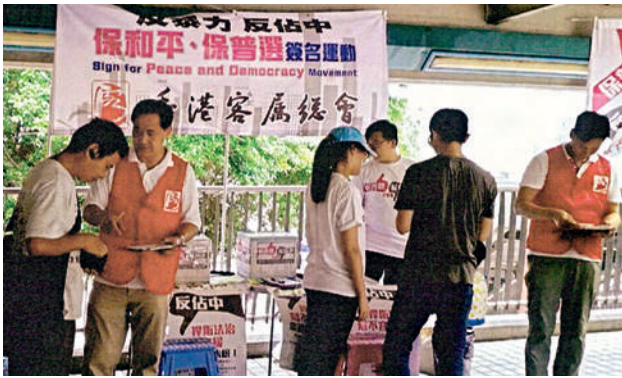
■ 本會設於紅磡火車站外天橋的簽名站，短短半天已接待了上百名熱心市民。

8月10日，在臨近簽名運動完結期間，梁主席及各首長親往街站慰問各義工，並感謝市民簽名支持。各首長發現是次運動有不少家庭成員全體參與的例證，父母連同子女一同上街呼籲市民簽名，使其他民眾皆受其熱誠感染，紛紛自動拿出身份證，在街站留下寶貴的簽名。