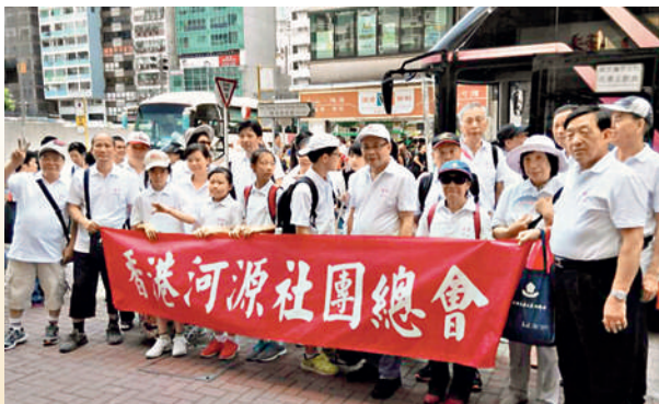
■ 2千多名香港河源社團總會各屬會的會員及親友參與大遊行，眾人熱情高漲，為保普選反佔中出一分力。