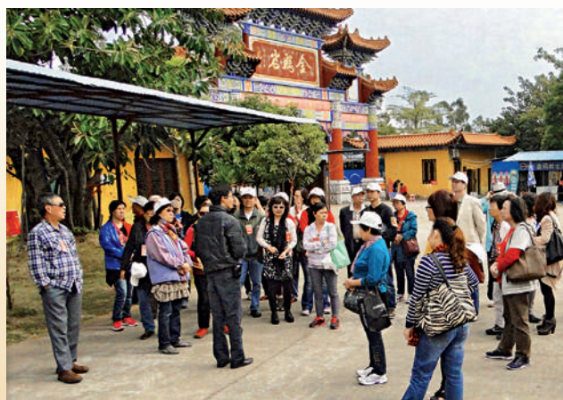
■ 客屬鄉親們細心聆聽導遊介紹金雞岩的歷史。