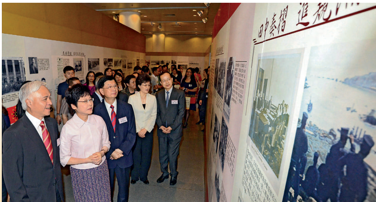
■ 楊釗、林鄭月娥、梁亮勝、姜瑜、楊健等主禮嘉賓仔細觀賞圖文並茂的展板。

2014年6月14至22日，香港各界紀念抗日戰爭勝利70周年系列活動——《從甲午之戰到抗戰勝利》大型展覽暨慶祝香港回歸祖國17周年於中央圖書館盛大舉行。展覽由本會和民政事務局、公民教育委員會、中華總商會、港台青年交流促進會、香港學生活動基金會、新界社團聯會、香港各界文化促進會慈善基金合辦，全港200多位社會各界知名人士和香港多個主要社團共同協辦。